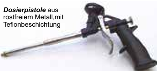
Dosierpistole aus rostfreiem Metall, mit Teflonbeschichtung

Die Verarbeitung des PU-Schaums mit der Dosierpistole ist sparsam, rationell und sauber. Die Dose kann bis zu vier Wochen auf der Pistole bleiben. Dosierschraube nach Gebrauch immer ganz zuschrauben!